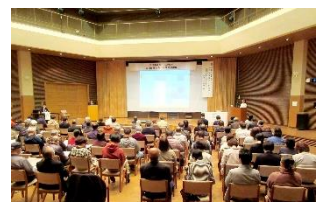
由利本荘市にかほ市公民館連合会様防犯片づけ講演の様子