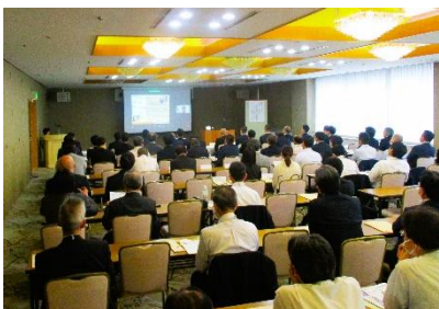
愛知県セルフガード協会様総会にてオンラインでの講演を行った際の様子

「正直、貴女のは聞かなくていいかな…と思っていたが、フタを開けたら貴女の話が一番興味深く刺さった」と大手メーカーの男性が名刺を持ってわざわざ声をかけに来て下さったことでした。各家庭の防犯意識醸成によって地域社会の防犯機器設置普及率向上の大切さを認識して頂けるよう今後も活動を模索したいと思います。